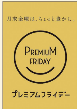
● LQ927 入数/300枚