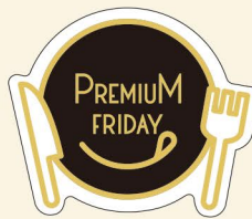
● LQ928 入数/200枚 (4種×50組)