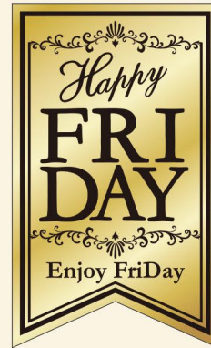
● LQ929 入数/300枚 (ノンアルミ使用)