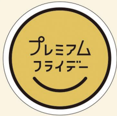
● LQ926 入数/300枚