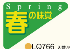
●LQ766 入数/500枚 (再ハクリ)