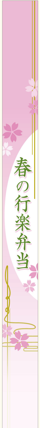
●LA575 入数/100枚 縮小しております (実サイズ 30mm×360mm)