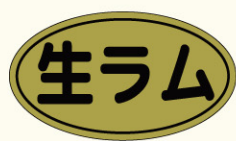
●LY493 入数/500枚 (金消しホイル使用)

「4(よう)2(に)9(く)」＝「羊肉」の語呂合わせで、ジンギスカン鍋の普及のため、「ジンギスカン食普及拡大促進協議会」が定めた記念日。ジンギスカンとは、北海道の人が羊の肉の食べ方を工夫するうち形づくられてきた郷土料理です。独特の形をした鉄鍋で羊肉と野菜を焼いて食べるのが一般的です。北海道では、昭和20年代後半に普及し、昭和30年代以降には家庭で食べるだけでなく、キャンプやお花見などで野外で料理するときの定番となっています。