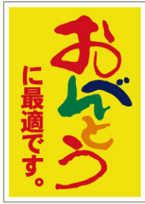
●LA251 入数/500枚 (ロールもあります)