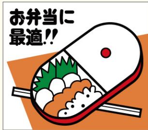
●LA11 入数/500枚 (ロールもあります)