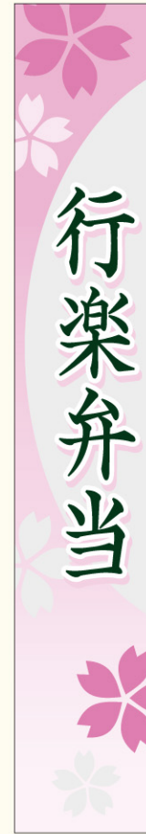
●LA561 入数/200枚 (マットPET使用)