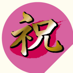
●LX257 入数/300枚 (金箔押し)