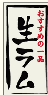
●LY495 入数/500枚 (マットPET使用)