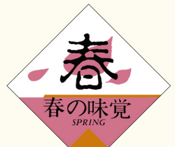
●LQ386 入数/500枚 (ロールもあります)