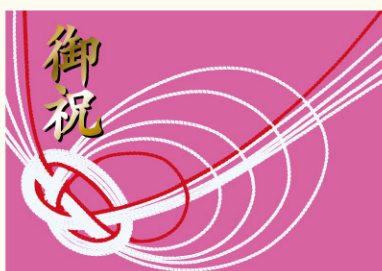
●LX258 入数/300枚 (金箔押し)