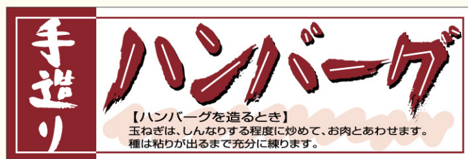
● LY285 入数/500枚