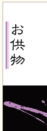
● LX240 入数/300枚