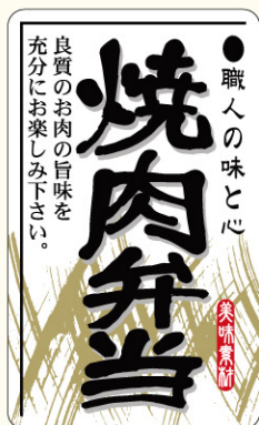
● LA450 入数/500枚