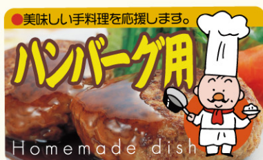
● LY475 入数/300枚