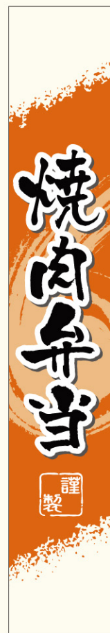
● LA567 入数/200枚 (透明PET使用)