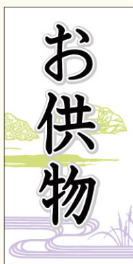
● LX131 入数/300枚