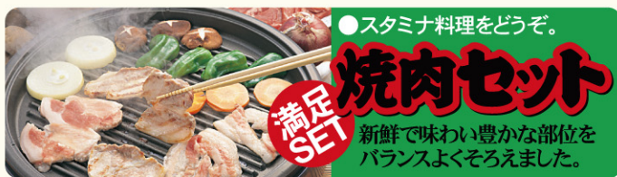
● LY424 入数/300枚