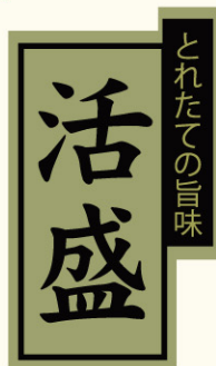
●LH883 入数/300枚 (金箔しホイル使用)