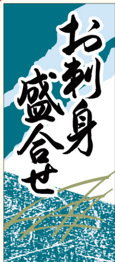
●LH881 入数/200枚 (金箔押し)