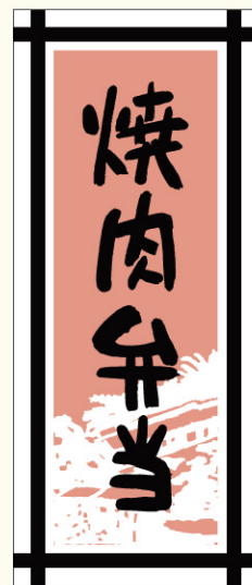
● LA296 入数/300枚