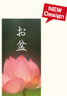
● LX381 入数/200枚