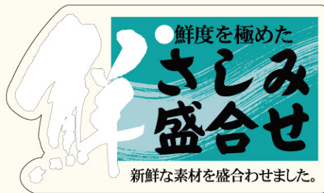
●LH858 入数/200枚 (透明PET使用)