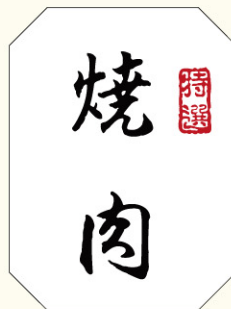
● LY315 入数/1,000枚 (和紙使用)