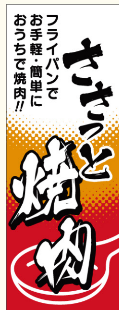
● LY512 入数/500枚