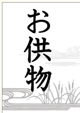
● LX132 入数/300枚

先祖や亡くなった人たちの霊を祀る行事、またはその期間。旧暦7月15日前後で行われることが多い。現在では、8月13日から16日までの4日間が一般的である。