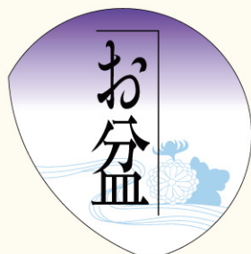
● LX81 入数/500枚 (ロールもあります。)