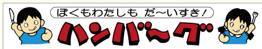
● LY102 入数/500枚