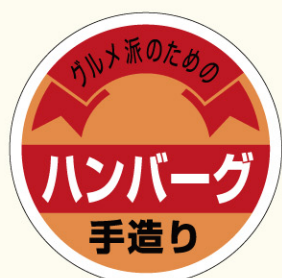
● LY100 入数/500枚

香川県三豊市に本社を置き、各種の冷凍食品の製造販売を手がけ、全国の量販店、コンビニ、外食産業などに流通させている株式会社「味のちぬや」が制定した日。子どもから大人まで幅広く愛されているハンバーグを、夏休みの期間中でもあるこの日に、さらに食べてもらいたいとの願いが込められている。8と9でハ(8)ンバーグ(9)と読む語呂合わせから。