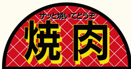
● LY264 入数/400枚(ロールもあります。)