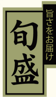
●LH884 入数/300枚 (金箔しホイル使用)