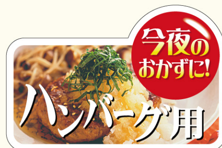
● LY523 入数/300枚