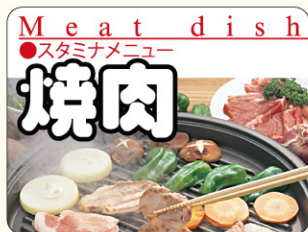
● LY553 入数/300枚

8月29日の「829」が「焼き肉」と読めることから。全国焼き肉協会が1993年に制定。 夏バテ気味の人に焼肉を食べてスタミナをつけてもらおうという日。