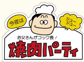
● LY57 入数/500枚(ロールもあります。)