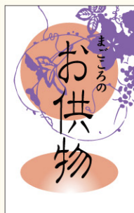
● LX92 入数/500枚