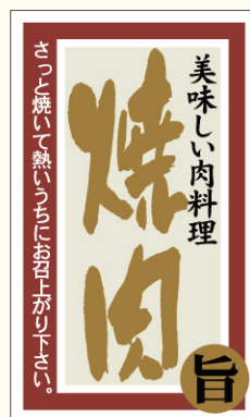
● LY515 入数/200枚 (マットPET使用) (金箔押し)