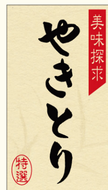
●LY500 入数/300枚 (和紙使用)