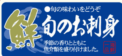
●LH882 入数/300枚 (金箔押し)