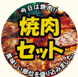
● LY472 入数/300枚