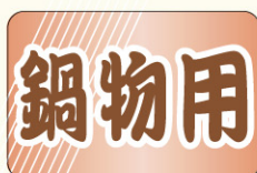
● LH688 入数/500枚