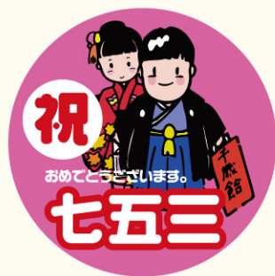
● LX188 入数/300枚

七五三(しちごさん)とは、7歳、5歳、3歳の子供の成長を祝う日本の年中行事。天和元年11月15日(1681年12月24日)に館林城主である徳川徳松(江戸幕府第5代将軍である徳川綱吉の長男)の健康を祈って始まったとされる説が有力である。