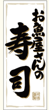
● LA432 入数/500枚