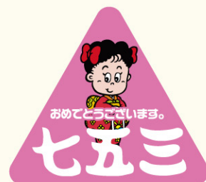
● LX187 入数/300枚