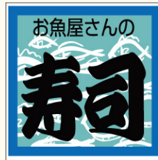
● LA353 入数/500枚