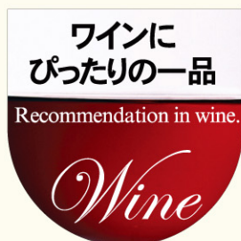
● LA477 入数/300枚