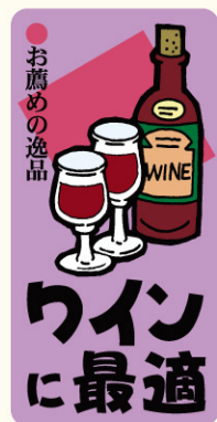
● LA675 入数/300枚