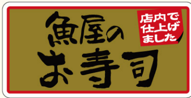
● LA662 入数/500枚