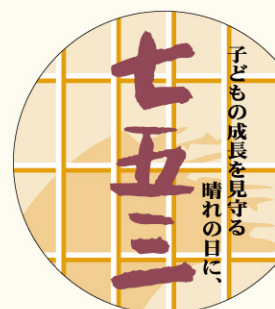
● LX221 入数/300枚