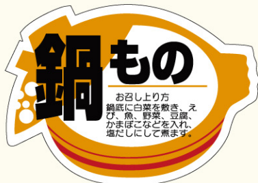
● LH25 入数/500枚 (ロールもあります。)