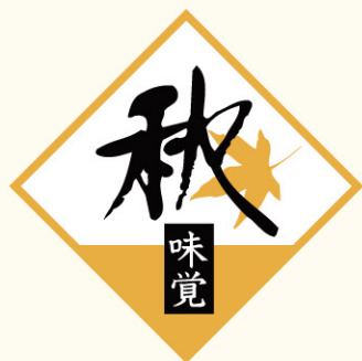
● LQ142 入数/500枚 (ロールもあります。)