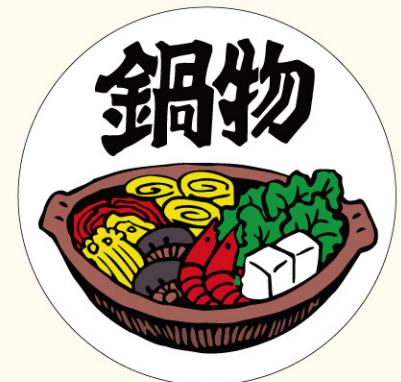
● LH288 入数/300枚 (ロールもあります。)