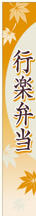
● LA562 入数/200枚 (マットPET使用)