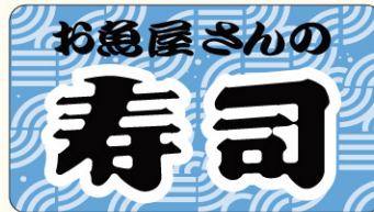
● LA350 入数/500枚