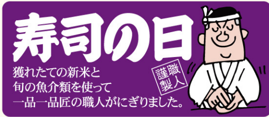
● LA476 入数/500枚

全国すし商環境衛生同業組合連合会が1961(昭和36)年に制定。 新米の季節であり、ネタになる海や山の幸が美味しい時期であることから。