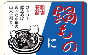
● LH869 入数/500枚