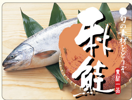
● LH720 入数/300枚

新潟県村上市が1987(昭和62)年に、 大阪市中心卸売市場「鮭の日委員会」 が1992(平成4)年に制定。 これらとは別に築地市場「北洋物産会」も制定。 「鮭」の隣の「圭」を分解すると「十一」になることから。