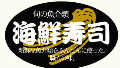
● LA445 入数/500枚