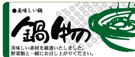
● LH332 入数/400枚 (ロールもあります。)