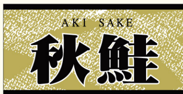
● LH671 入数/500枚