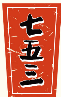
● LX220 入数/400枚