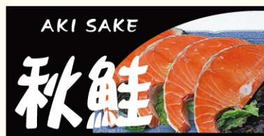
● LH663 入数/300枚