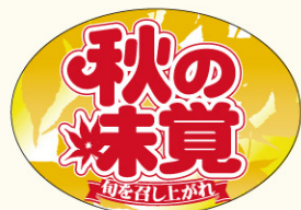
● LQ661 入数/500枚