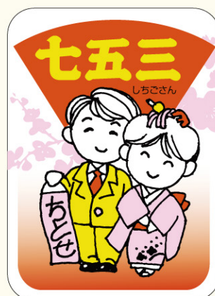
● LX135 入数/300枚