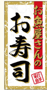
● LA588 入数/500枚 (再ハクリ)