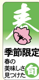
● LQ757 入数/500枚