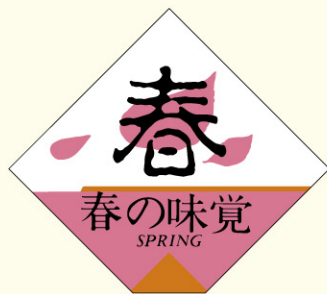
● LQ386 入数/500枚 (ロールもあります)