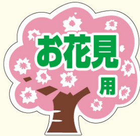
● LX259 入数/500枚