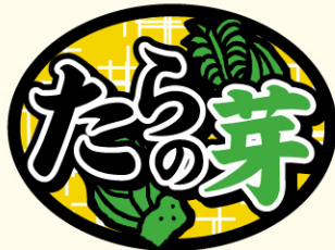
● LZ653 入数/500枚