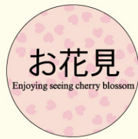
● LX333 入数/500枚