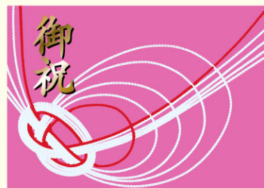
● LX258 入数/300枚(金箔押し)