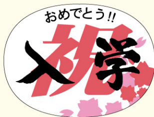
● LX206 入数/300枚