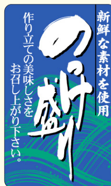
● LH473 入数/500枚