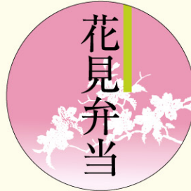
● LX123 入数/500枚