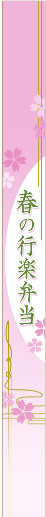
● LA575 入数/100枚 縮小しております (実サイズ 30mm×360mm)