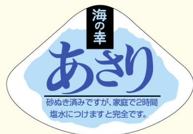
● LH292 入数/400枚