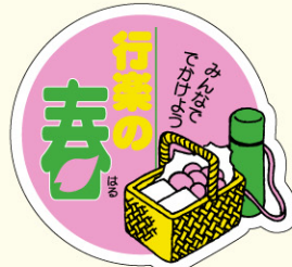
● LX122 入数/300枚