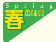
● LQ766 入数/500枚 (再ハクリ)