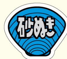
● LH163 入数/1000枚 (ロールもあります)