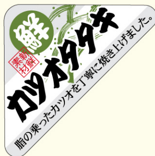
● LH753 入数/500枚