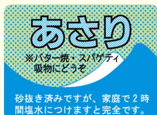
● LH168 入数/500枚