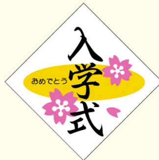
● LX75 入数/500枚