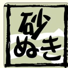
● LH639 入数/500枚