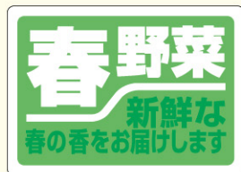
● LZ291 入数/500枚