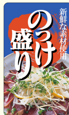
● LH474 入数/300枚