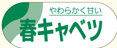
● LZ268 入数/500枚