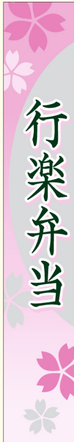
● LA561 入数/200枚 (マットPET使用)