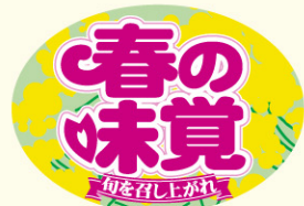
● LQ659 入数/500枚