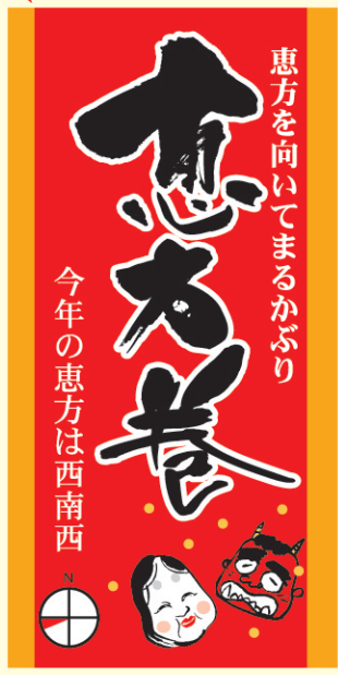
● LX459 200枚