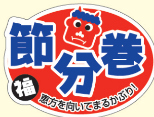
● LX314 500枚