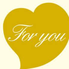
● LX271 200枚 (金消しホイル使用) (白箔押し)