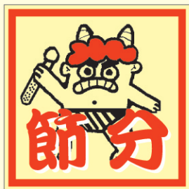
● LX238 500枚