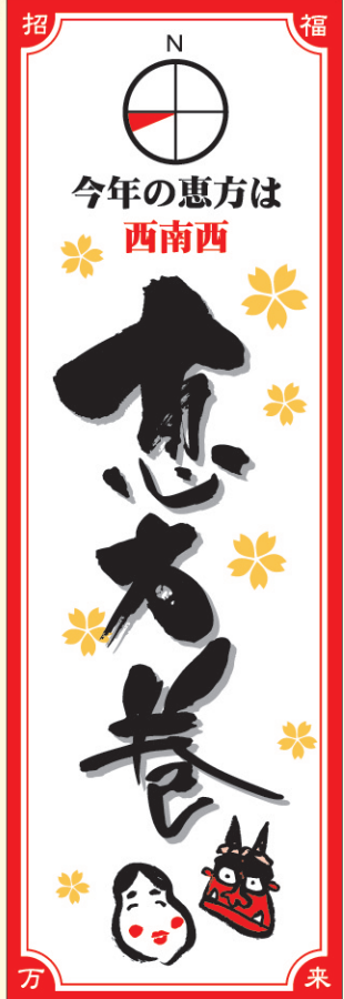
● LX461 200枚