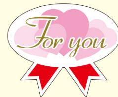
● LX273 300枚