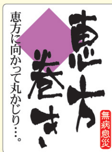
● LX302 300枚 (和紙使用)