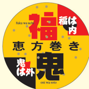
● LX243 300枚