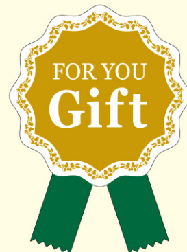
● LX310 90枚 (金箔押し) (リボン付き)