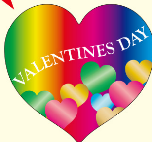
● LX442 200枚