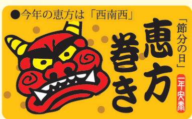
● LX463 300枚