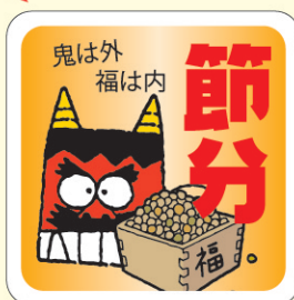
● LX456 300枚