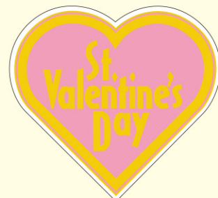
● LX57 300枚 (金箔押し)