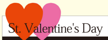
● LX113 300枚