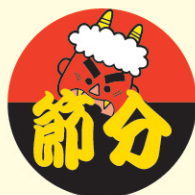
● LX319 500枚