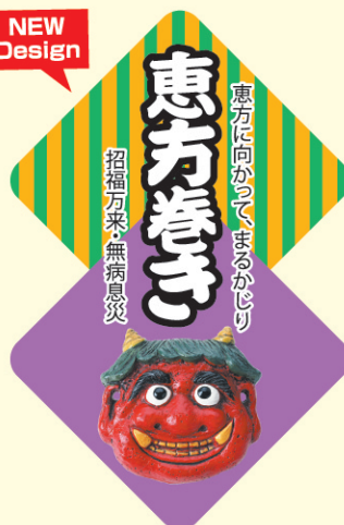
● LX457 300枚