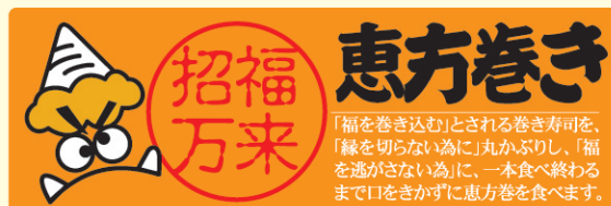
● LX458 300枚

「福を巻き込む」とされる巻き寿司を、「縁を切らない為」に丸かぶりし、「福を逃さない為」に、一本食べ終わるまで口をきかず恵方巻を食べます。