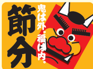
● LX249 300枚