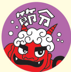
● LX27 500枚