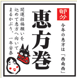
● LX464 300枚