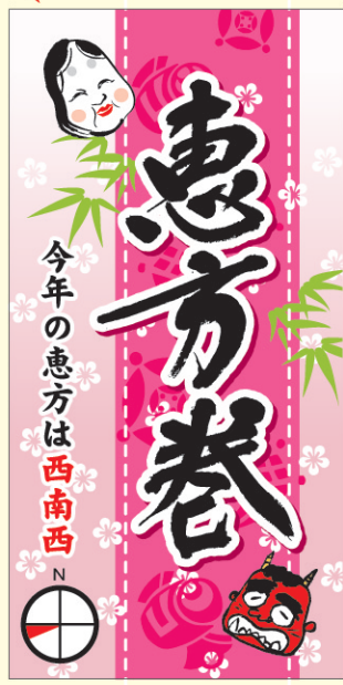
● LX460 200枚