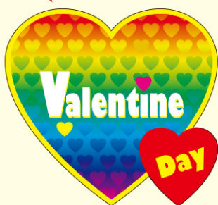
● LX440 200枚