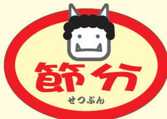
● LX112 500枚