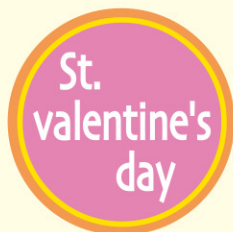
● LX114 500枚