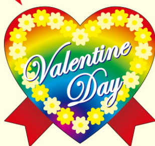
● LX441 200枚