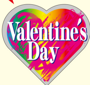
● LX443 200枚