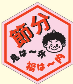
● LX239 500枚