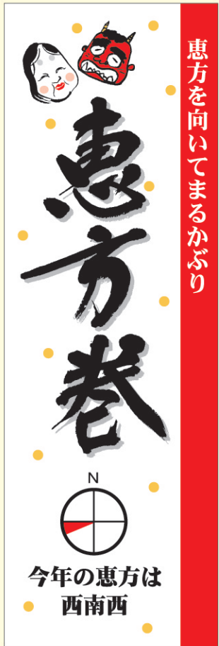
● LX462 200枚