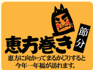
● LX242 300枚