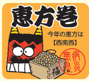
● LX465 300枚