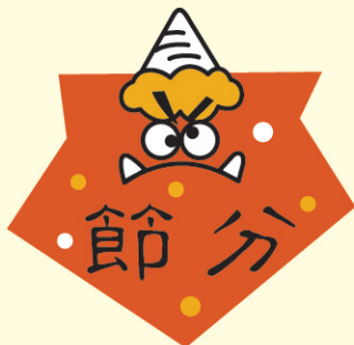
● LX88 500枚