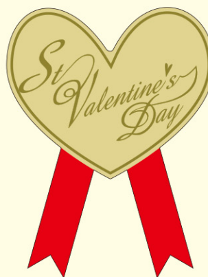
● LX309 90枚 (金消しホイル使用) (金箔押し) (リボン付き)