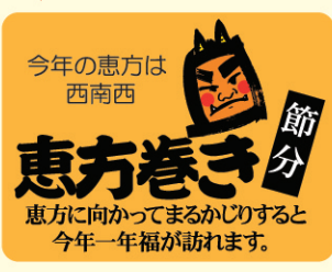
● LX466 300枚