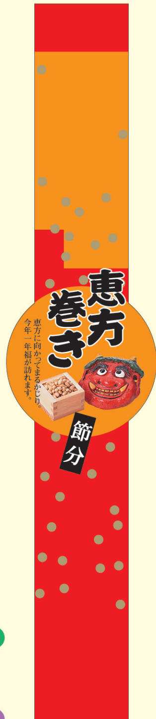
● LX360 100枚 7ヶ 寸 190mm×40mm 全面糊タイプ