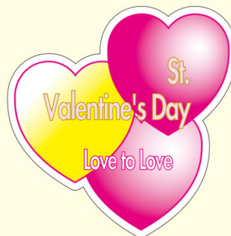
● LX198 300枚