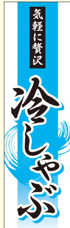
● LY580 入数/200枚 (トレーシングペーパー使用)