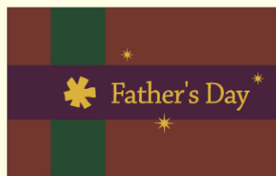
●LX290 入数/200枚 (金箔押し)