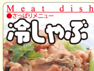
● LY551 入数/300枚