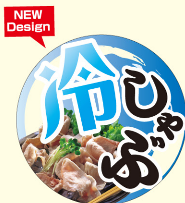
● LY603 入数/200枚 (透明PET使用)(コールド箱使用)