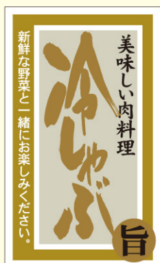
● LY517 入数/200枚 (マットPET使用)(金箔押し)