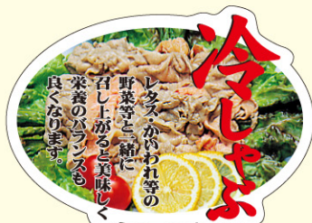
● LY229 入数/300枚