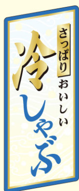
● LY569 入数/500枚 (透明PET使用)(金箔押し)