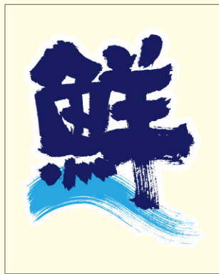
● LH971 入数/200枚 (透明フィルム原紙使用)