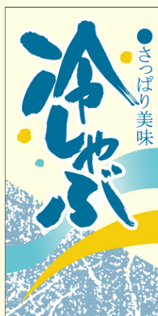
● LY549 入数/200枚 (透明PET使用)(金箔押し)