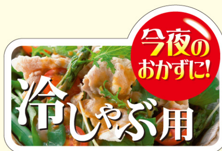
● LY528 入数/300枚