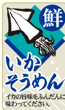
● LH846 入数/200枚 (マットPET使用)