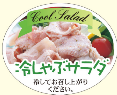
● LY536 入数/300枚