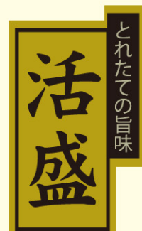
● LH883 入数/300枚 (金消しホイル使用)