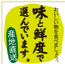
● LZ678 入数/300枚