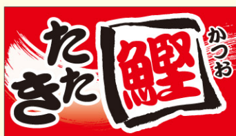
● LH915 入数 /500枚