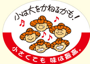
● LZ610 入数/500枚

目的: 外見の悪い商品の販促 用途: 形がいびつ、色気がイマイチの青果物に貼付する。 特徴: 見てくれは悪くても味は最高である事を強調している。人の情に響くコメントである。