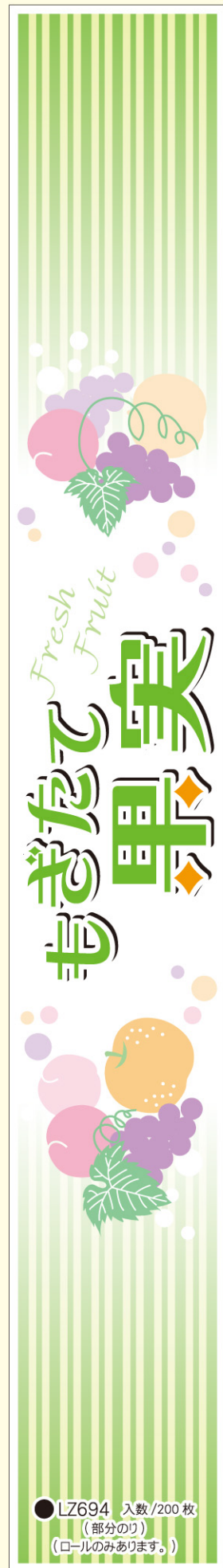
● LZ694 入数/200枚 (部分のり) (ロールのみあります。)