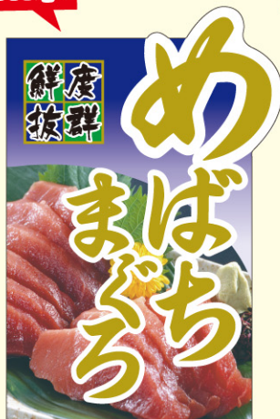
● LH977 入数 /200枚 (コールド箱使用)