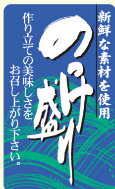
● LH473 入数/500枚