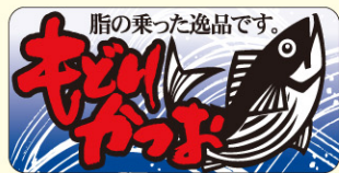
● LH848 入数/500枚