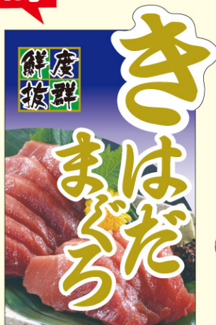
● LH978 入数 /200枚 (コールド箱使用)