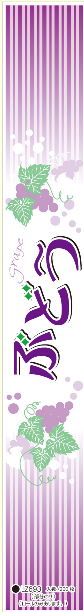
● LZ693 入数/200枚 (部分のり) (ロールのみあります。)