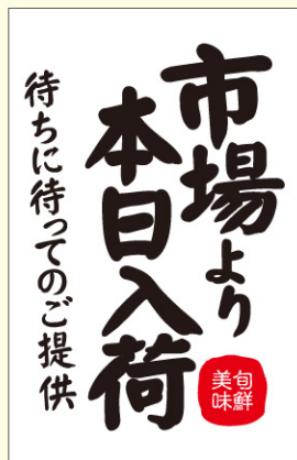
● LH892 入数/300枚 (上質紙使用)