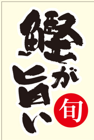
● LH941 入数 /200枚 (透明PP使用)