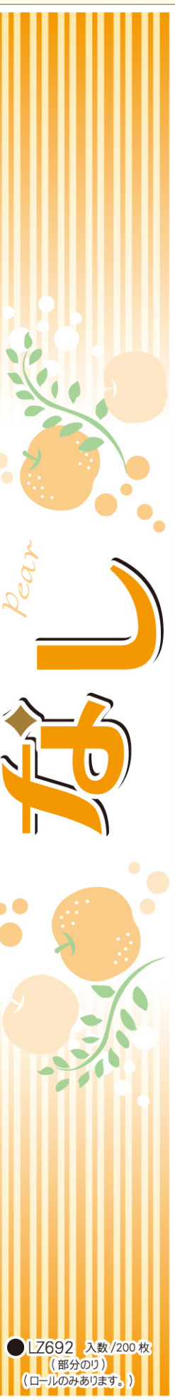
● LZ692 入数/200枚 (部分のり) (ロールのみあります。)