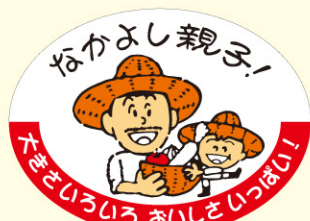
● LZ608 入数/500枚

目的: 傷ついた商品の販促 用途: 傷ついた外見のため、本来なら販売されない青果物に貼付する。 特徴: 傷の有無は味の善し悪しに関係ない事を表現しています。