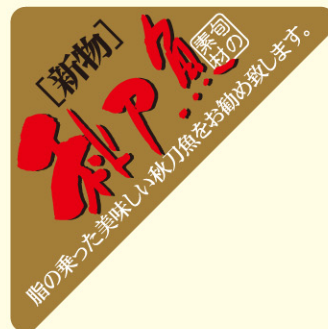
● LH723 入数/500枚