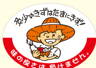
● LZ607 入数/500枚

目的: 傷ついた商品の販促 用途: 傷ついた外見のため、本来なら販売されない青果物に貼付する。 特徴: 傷の有無は味の善し悪しに関係ない事を表現しています。