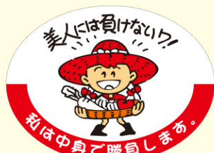
● LZ609 入数/500枚

目的: 大きさが売れ筋と比較して不揃いな商品の販売 用途: 中身の大きさが不揃いな商品に貼付する。 特徴: 大きさが不揃いでもそれぞれが美味しい事を表現している。