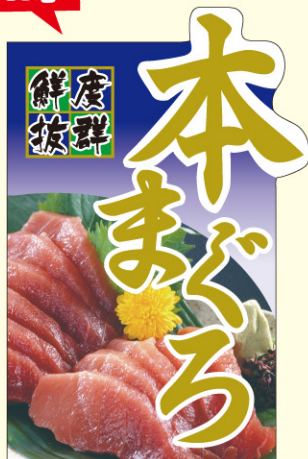
● LH976 入数 /200枚 (コールド箱使用)