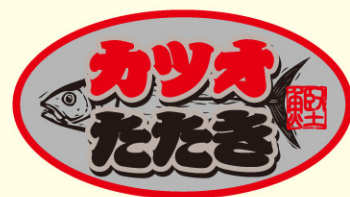
● LH914 入数 /500枚 (銀消しホイル使用)