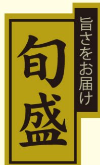
● LH884 入数/300枚 (金消しホイル使用)