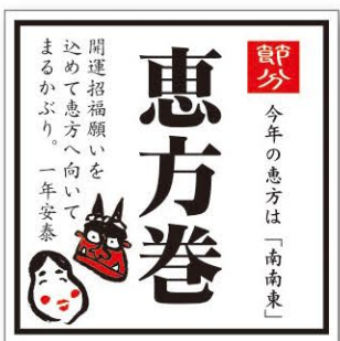
● LX527 入数/300枚