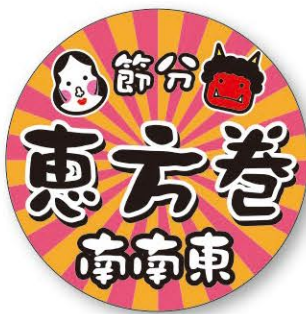
● LX528 入数/300枚