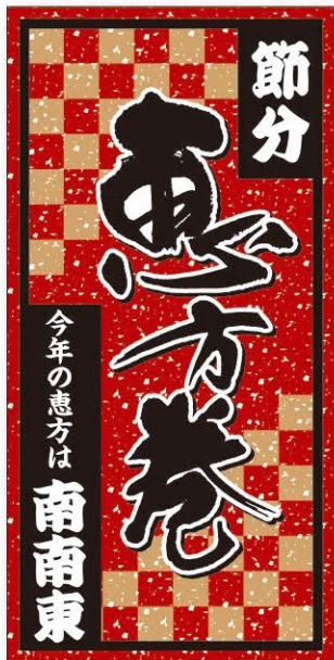
● LX524 入数/200枚