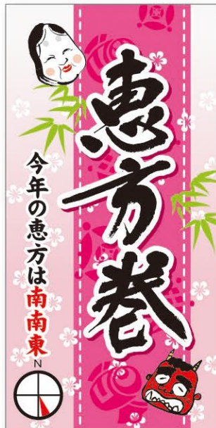
● LX525 入数/200枚